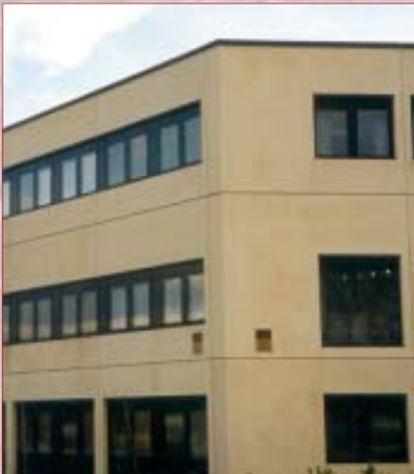
MINICOAT FARGET BETONG