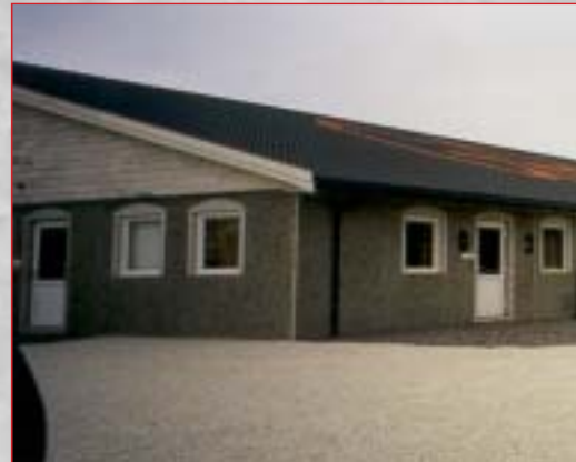
FRILAGT GRÅ NATURSTEIN